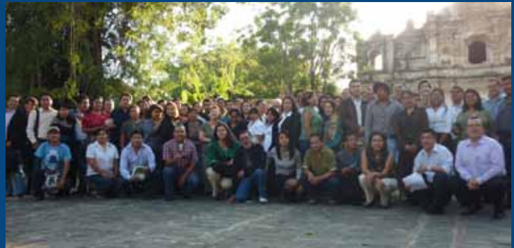
Taller realizado en Antigua Guatemala, Guatemala.