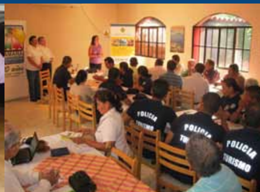
De izquierda a derecha: Talleres realizados en León Nicaragua, San José Costa Rica y San Juan Opico, El Salvador.