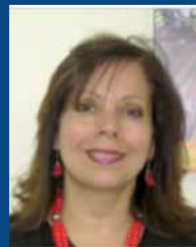
Licda. Mercedes Meléndez de Mena, Secretaria de Integración Turística Centroamericana (SITCA)

“Aspiramos a que OEA, así como otros cooperantes, continúen apoyándonos para incrementar la competitividad de las MIPYME turísticas de la región; ya que este proyecto nos ha dejado como lecciones aprendidas la urgente necesidad de continuar con capacitaciones descentralizadas (a un nivel local), incluyendo a toda una cadena de actores relevantes como lo son las policías turísticas, municipalidades, migración, etc.” puntualizó.