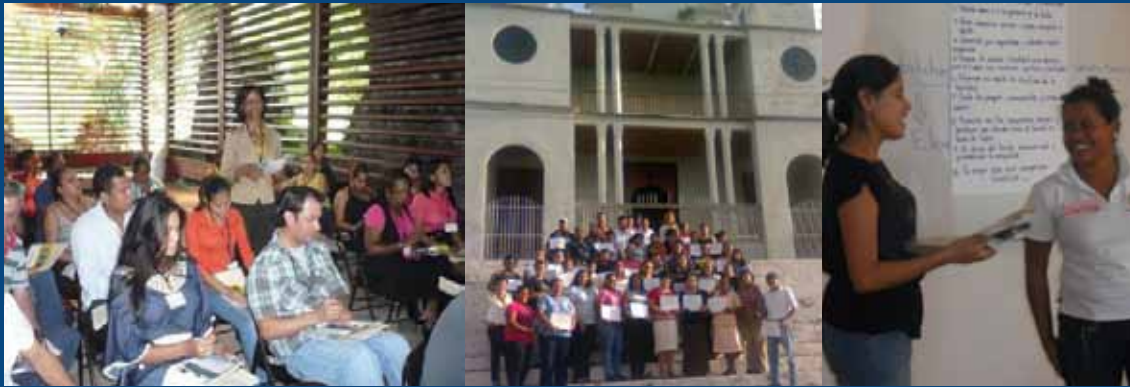
De izquierda a derecha: Talleres realizados en Panamá Viejo, Panamá; Alegría, El Salvador y Matagalpa, Nicaragua.

Objetivo: “Desarrollar un programa de formación en cultura turística, orientado a la formación de formadores y MIPYMES turísticas de la región”