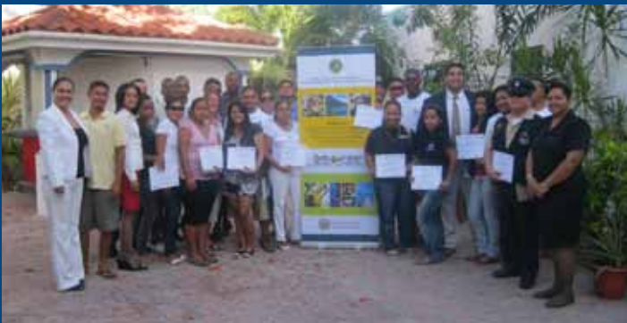
Taller realizado en San Pedro, Belice.