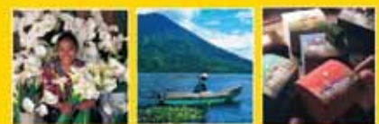
MANUAL REGIONAL DE CULTURA TURÍSTICA